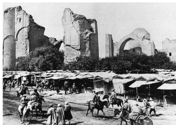
2-расм. Масжиднинг авария ҳолатидаги кўриниши