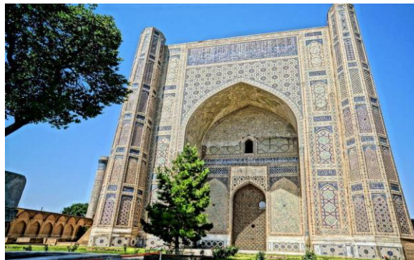
3-расм. Масжид пештоқининг авария ҳамда тикланган ҳолатлардаги кўриниши