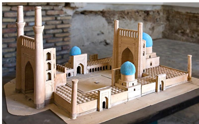
1-расм. Бибихоним жоме масжидининг асл ҳолатдаги кўриниши

Юқоридаги фикрларимизнинг яққол намунаси сифатида кўп асрлардан бери бизгача сақланиб келаётган ноёб иншоотлардан бири Самарқанд шаҳридаги Бибихоним жомъе масжиди ҳисобланади. Иншоот ўзининг кўркамлиги ва улуғворлиги жиҳатдан XIV-XV асрларга оид ёдгорликлар орасида энг йирик ва ноёб обидалардан бири ҳисобланган. Масжид 1399-1404 йилларда Самарқандда Амир Темур ҳукмронлиги даврида бунёд этилган. Бибихоним жоме масжиди соҳибқирон Амир Темур Ҳиндистон сафаридан қайтгач, унинг фармони билан қурила бошланган. Масжидни қурган уста ва меъморларнинг номлари сақланиб қолинмаган. Масжид бир неча иншоотлардан ташкил топган бўлиб, Бибихоним мадрасаси билан катта мажмуани ташкил этган [3].