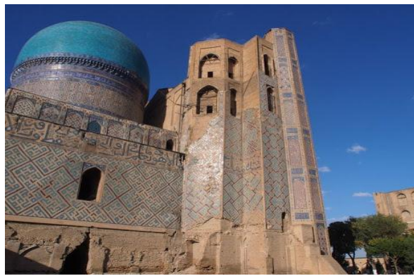
4-расм. Масжид авария ҳамда тикланган ҳолатлардаги ён томондан кўриниши